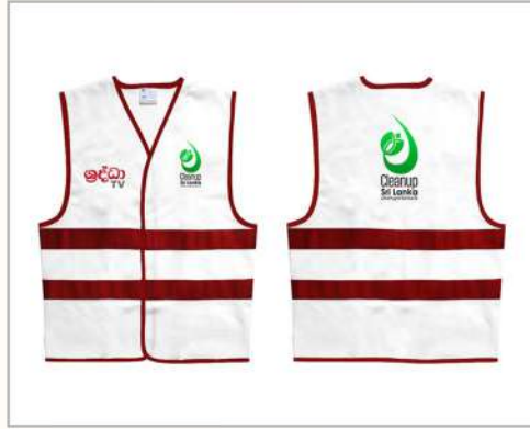
Jacket ( කණ්ඩායම් නායකයින් සඳහා ) (For team leaders)

ஒவ்வொரு குழுவிற்கும் வழங்கப்படும் பொருட்கள் மற்றும் உபகரணங்கள்வீற்று கீனீரீகூழீரி